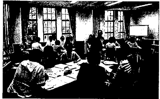
CARE 実習風景「質疑応答」

今回のワークショップでは、冒頭で述べたように、初めて本学大学院の修了生2名がコ・トレーナーとして、筆者とともに講師を務めた点が画期的