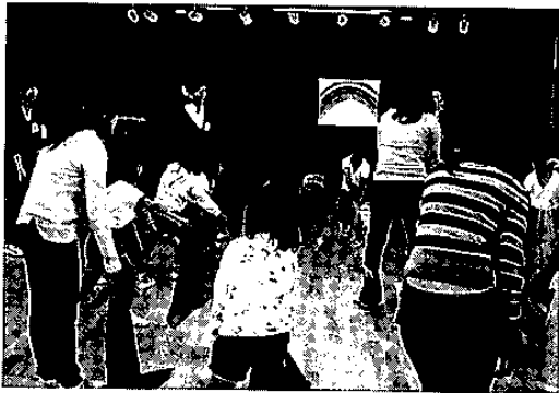
色とりどりのスカーフを使って

プログラムはまず、英語による挨拶と自己紹介でスタート。続いて、虹の歌「Rainbow Song」をもとに、色の英語名を指導しました。その際、英語と色が一致するように、色紙カードや虹の絵を用いるなどの工夫を施しました。各自色とりどりのスカーフを振りつつピアノ伴奏にのって歌いながら踊る場面で、園児たちは一段と元気に！学生は、要所所で英語の発音や歌詞を指導しました。学生も園児も、前半は少し緊張気味でしたが、後半にはリラックスして和やかな雰囲気の中に終えることができました。