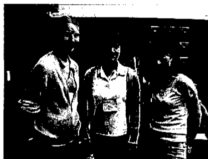
クラスメイトたちと

でした。参加者同士もハードスケジュールを共に過ごす事により、短期間にもかかわらず、とても仲良くなる事ができました。