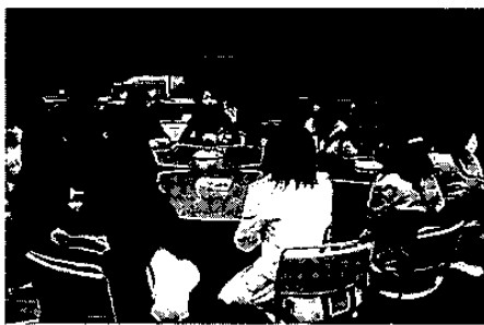
ディスカッションの様子