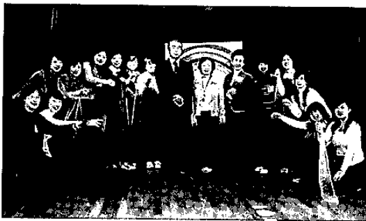
第1回ひよこプロジェクト参加者一同