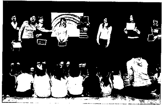
虹の色を覚えましょう

新たな長期プロジェクトの一つ、「ひよこプロジェクト」が始動しました。本プロジェクトは、英語の歌とリズムで、子どもたちに外国語の響きとリズムに慣れ親しんでもらおうというもので、英文学科と音楽学科の学生が共同で行います。今年度は英文学科教職課程履修生（四回生）七名、音楽学科「音楽によるアウトリーチ」履修生（三回生）二名、二回生一名の計十名が参加しました。