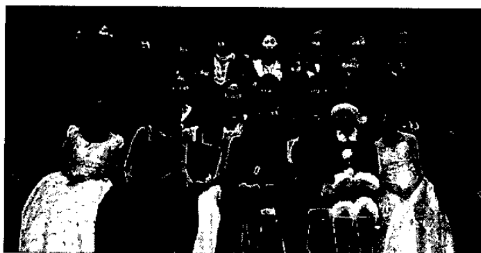
出演者、スタッフ一同

出演者は、たくさんのお客様との触れ合いを通じて学んだことが多く、また、会場の温かい雰囲気やお客様の反応を感じ取ることができて、今後演奏活動が続けていく大きなエネルギーともなったようです。出演者、お客様、そしてコンサートを支えてくれた裏方のスタッフ全員が一体となつて、今回のコンサートを作りあげることができました。今後も地域の皆様に喜ばれる子どものためのコンサートをお贈りしたいと思います。(寺澤彩・記)