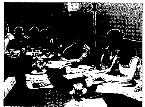
終演後は出演者とスタッフで反省会