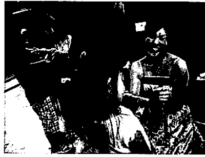
フルートを吹いてみよう！

それぞれが自分たちの出している音を曲と共に楽しんでる様子でした。終演後はおなじみの楽器体験コーナーです。コンサートで使った楽器（フルート、ヴァイオリン、ピアノ、チェレスタ、トーンチャイム）を実際に体験してもらいました。子どもたちは、楽器から音が出た瞬間その音にびっくりしたり、コンサートで歌った《きらきら星》を弾いてみたりと、楽しそうに目を輝かせていました。また、そんな子どもたちを見ていると、私たちも音との出会いの大切さを改めて感じました。