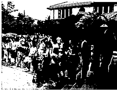
開場前からたくさんのお客様

七月七日(土)、本学講堂にて「子どものためのセタコンサート」(子どものためのコンサート・シリーズ第十七回)を開催いたしました(第一部・十一時、第二部十五時、来場者数九六五名)。