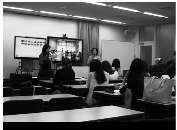
※写真は東京音楽大学での様子です。