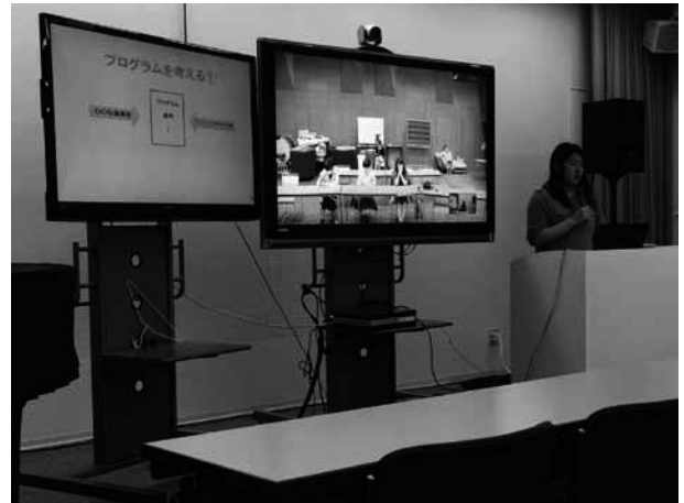
※写真は東京音楽大学での様子です。