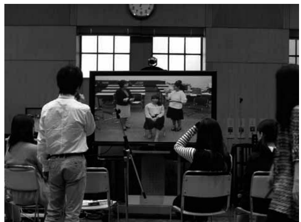
※写真は神戸女学院大学での様子です。